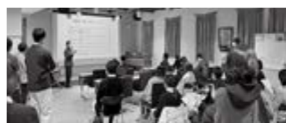
若者たちが集まり「交流会WAKAMACHI」を12月11日「えい坊館」で開催

業として、伸びゆく町民運動推進事業、わがまち夢プラン事業、地域づくり応援事業がある。今年度、若者を集めてワークショップ等を行う『ワカマチプロジェクト』を始めている。