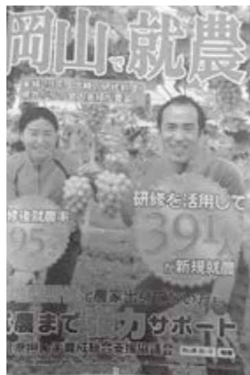
岡山県が推進する就農支援

U・Jターンや田舎暮らし、新規就農を希望する人など住んでみたいという人を対象に、空き家等を有効活用した「お試し住宅」を一定期間提供して、移住・定住を促進しています。平成29年から令和3年までに22組がお試し住宅を利用し、そのうち9組が定住されました。