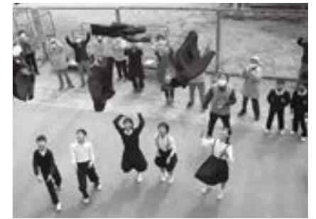
高梁・巨瀬小学校「サプライズ卒業式」

教育の充実では、特に地域との連携強化を図るため、コミュニティ・スクールを推進しています。例えば、路線バスの利用者を増やす方法とか、備中牛の地元消費の拡大など、地域の課題を生徒自らが現場に足を運び実態調査、その後解決策を実践していく取り組みです。学校と地域の目的が一致し、地域に関わることで地域を愛する心と、社会の発展に積極的に貢献できる力を身につけるねらいがあります。最後に高梁市の職員が次のような話をしてくれました。新型コロナで卒業式に出席できない住民が、幼稚園児と共に約50人「サプライズ卒業式」として玄関前で卒業生一人一人の名前とお祝いメッセージを書いたプラカードを持って、出迎えてくれました。思わず涙ぐむ子や「大好きなこの町に大きくなって恩返しをしたい」という子もいました。