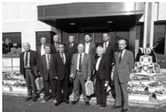
勝央町役場前にて

勝央町は面積54km 2 、人口約11000人と小さな町です。平成の合併は行わず、昭和29年に1町4村が合併しました。町内には中国自動車道のJCTがあるため、早くに国営事業の中核工業団地が整備され、30企業、2800人が勤めています。それでも人口減少傾向に歯止めがかかりません。特に、農村部では農業従事者の高齢化や担い手不足が進んでいるため、農業や文化などを生かした体験交流の機会を設け、交流人口・関係人口の増加と移住・定住の促進を図っています。