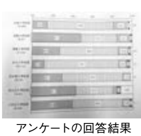
アンケートの回答結果