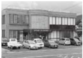
上志比公民館上志比振興会事務局

答 よそのもの、若者、ばかもの色々な方々と連携する。 問 どんな公園を作りたいのか。 答 望ましい公園像を検討する。 問 子どもの遊び場建設に県が1億円の話をどうなったのか。 答 町内の公園や公共施設、上志比地区での施設等を視野に。