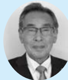
永平寺町議会議長