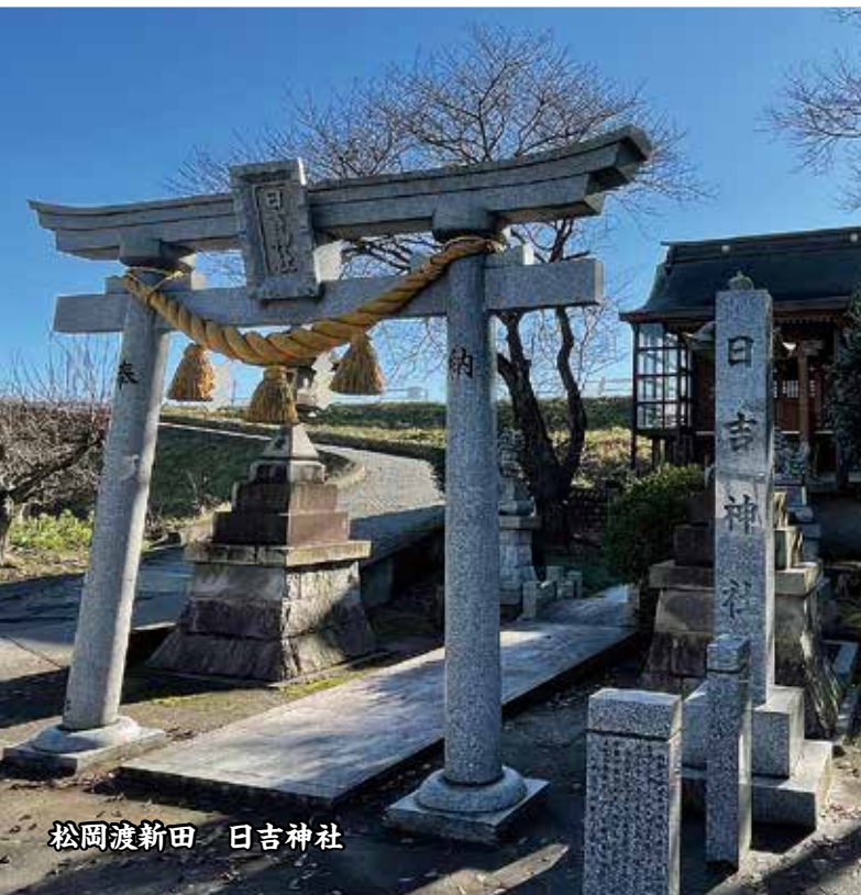
松岡渡新田 日吉神社