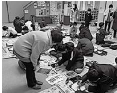
かさじぞう学習支援

答 国の閣議決定により、12月の補正となった。伴走型相談支援は国から示された内容により対応。