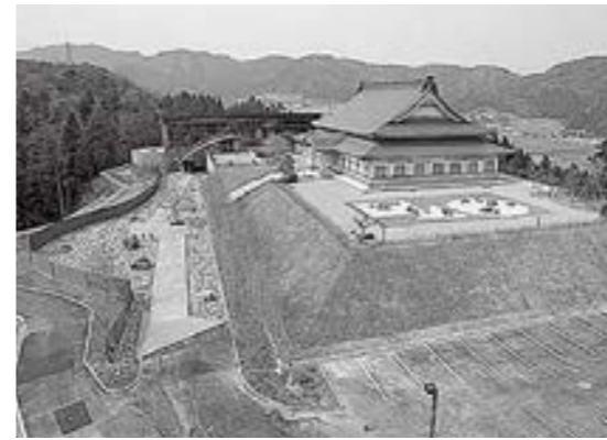
四季の森複合施設全景

問 物価高騰による施設管理費だが、四季の森の補正額が他と比べ大きいのは理由があるのか。