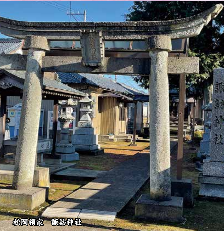
松岡領家 諏訪神社