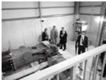
おおい町小水力発電所見学

将来の住民自治の一環として、かかる地域資源を活用し、SDGsやゼロカーボンシティの取り組みにより住民自らが挑戦でき、国、県、永平寺町の再生エネルギー促進政策にもその改革を求めながら、地域電力を立ち上げ電力供給できるような進めることが指標となると考えられる。また、このことは多くの関係者が参加することによって地域経済の発展にも寄与することとなると考えられ、促進に向けての検討を継続する。