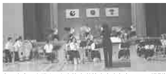
全国大会に出場する上志比中学校吹奏楽部(10月3日撮影)

問 集落消防施設整備補助(消火栓用ホース、筒先等)の2分の1は少なすぎる。自主防災の個人的な物(ヘルメット等)には8割もあるのに集落全体の公共性備品が5割ではおかしい、検討をすべき。 答 合併以前は各々の町村で補助内容は違っていた。平成22年より今の規定で運用している。検証検討して対応を考えている。