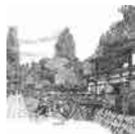
旧参道の再生イメージ図