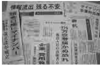
新聞記事よりマイナンバー制度

問 町長は首都圏で若いやる気のある人材を採用し、観光物産協会に派遣し経験を積ませ、町の観光の発展に繋げたいとの意向であったと思うが現在はそのようになつたか。 町長 地域おこし協力隊の件だと思ふ。手を挙げられる方が少なく、最近になつて名古屋の方が手を挙げたので、近々面接する。 問 役場職員の皆さんはそれぞれに勉強され、能力のある方が多いと思 町長 現在滞納整理機構に毎年一人派遣してお