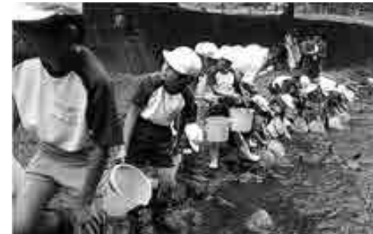
志比南小学校ヤマメ稚魚放流

問 鳴鹿大堰から上流の有効範囲と活性化のPRを。 建設課長 大堰のゲート操作による水位の変化等、安全性を考慮すると鳴鹿橋下流は利用できないが、鳴鹿橋上流はアユ釣り客や河川利用者等の迷惑にならないよう自己責任により利用可能である。河川区域内に構造物等やカヌー大会等のブイを浮かべる場合は、河川占用許可が必要。 問 毎年費用がかかる燈籠流し水路の整備と流す位置の地盤整備を。 建設課長 志比小学校裏の上流の河川公園は県土木、下流の燈籠を流す位置や駐車場は国交省が造 問 成、上流の河川公園に沿った水路の石が増水等によって流れた経緯があるとのことで、復旧について可能かどうか県・国と十分に相談する。 問 高橋地区の河川区域内には環境教育としてのピオトープ公園と、燈籠流し日本一の夜景遺産近くに不法投棄ゴミの山を