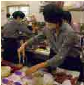
イベント時は早朝2時からフル稼働

“ハンドメイド風ふう”で 一番のこだわり はとお聞きしたところ、 手作りにこだわり、極力地元の食材 を生かし、味付けもご注文の際に 食するお客様の年齢とか場所をイメージ して作っていると胸を張っ