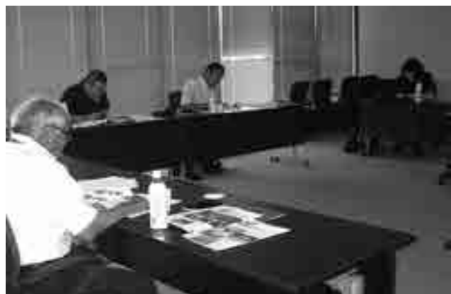
出雲市公民館視察

イで、いろいろなことを企画運営する公民館を目指している。 問 町長が思い描いている構想を、具体的に表した今後の公民館のあり方を有識者、関係者