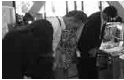
職員のあいさつ運動

が、ゴミや公害について の苦情は多く寄せられて おり、職員が迅速に現場 確認をし、原因等の除去 が出来る物は速やかに対 応している。 問 年間の要望が560 件に増え、地元負担金も ゼロと聞くが財政が厳し い今、少しでも負担金は