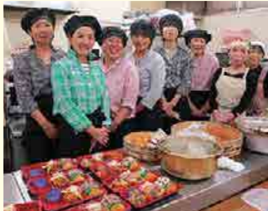
「美しく、楽しく食べたいをモットーに」と皆さん