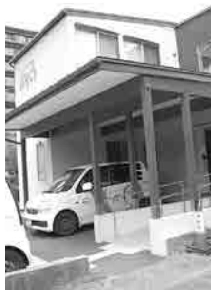
米子市：まちくら宅老所

問 まちづくり会社の設立を 答 設立に向け事業計画を検討 町長 まちづくり会社は成功しているところもあるが、難しい仕組みもある。調査研究をしっかりと行って、永平寺町にとって必要であれば、皆様と相談して進める。 問 在宅福祉の広がりは民間に丸投げするのはなにもできない。県や市町が積極的に力を注ぐべきでは。 福祉保健課長 平成28年度開設を目的に、グループホームと小規模多機能の施設の募集を9月から始める。