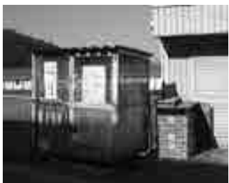
東古市ふれあい会館(横)ごみステーション