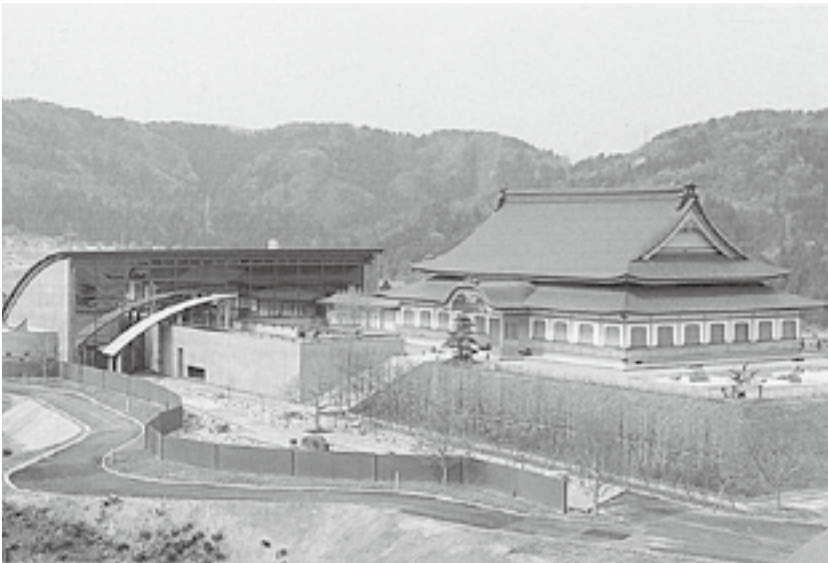
緑の村四季の森文化館

これまでの取り組みにつきましても、着実な成果を見たものと思っております。課題は山積しておりますが、町民の皆さんのご支援、ご支持が得られるならば再び町政を担当させていただいて、非常に厳しい時代であります。責務を全うしたいと考えています。