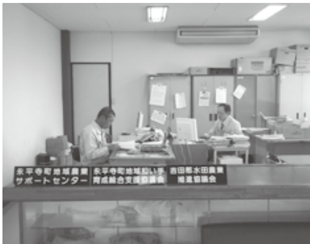
吉田郡水田農業推進協議会

議会で職員を送っている。本来、推進協議会の業務を行政が主体的に運営を行うと理解してください。本町の職員とJAの職員がお互いに協議会に事務を従事させて、農家の皆さんへの一元化を図ることが目的であります。