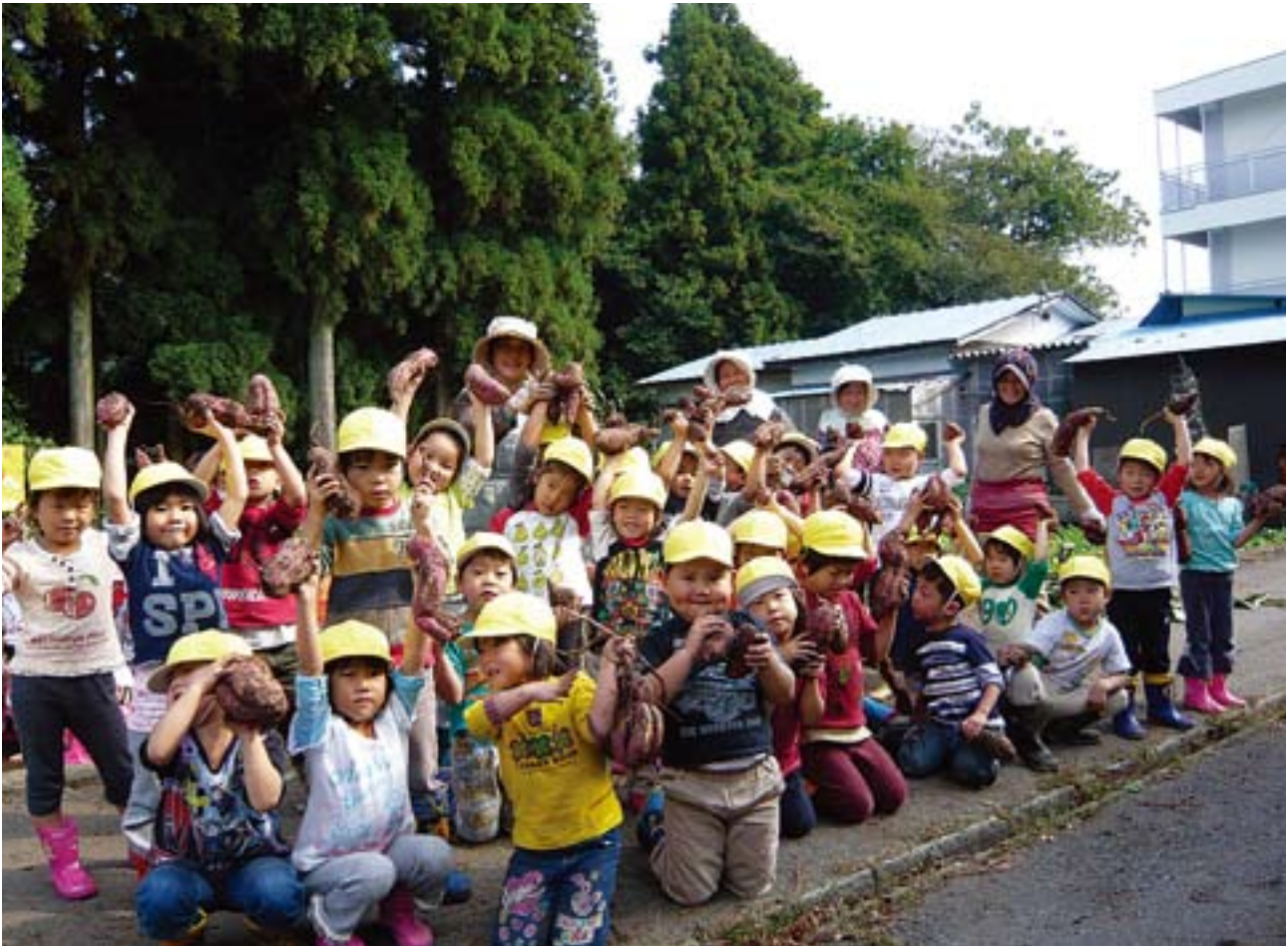
地域交流事業芋ほり（志比幼稚園）