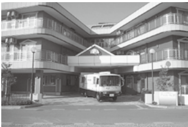
特別養護老人ホーム

福祉保健課長 小規模特別養護老人ホームは、今後の高齢化社会を考えると町も必要であることは認識しています。ただ、事業者は社会福祉法人格を有することがまず前提条件となります。また、介護施設が増えれば介護給付費が増え、介護保険料の上昇にもつながりますので、設置は介護保険運営協議会などの協議を