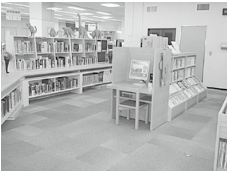
町立図書館永平寺館

町長 これまで就任から三年半が経っておりますが、町民の皆さんの視点で声を聞いて、本当に合併したことがよかったと言われるまちづくりをしたいと思えます。特に子供たちの明るい元気な声が弾ける町ということで、子育て支援や教育環境整