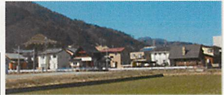
町が造成した栗住波団地