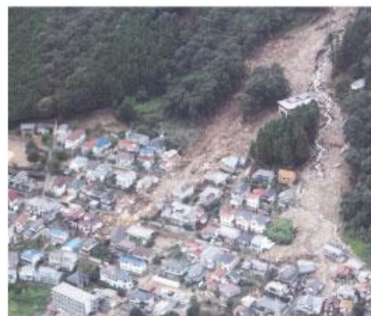
広島市の土砂災害

そこで、住民の皆さんが今思っていること・不安なことなどについて一緒に考えましょう。